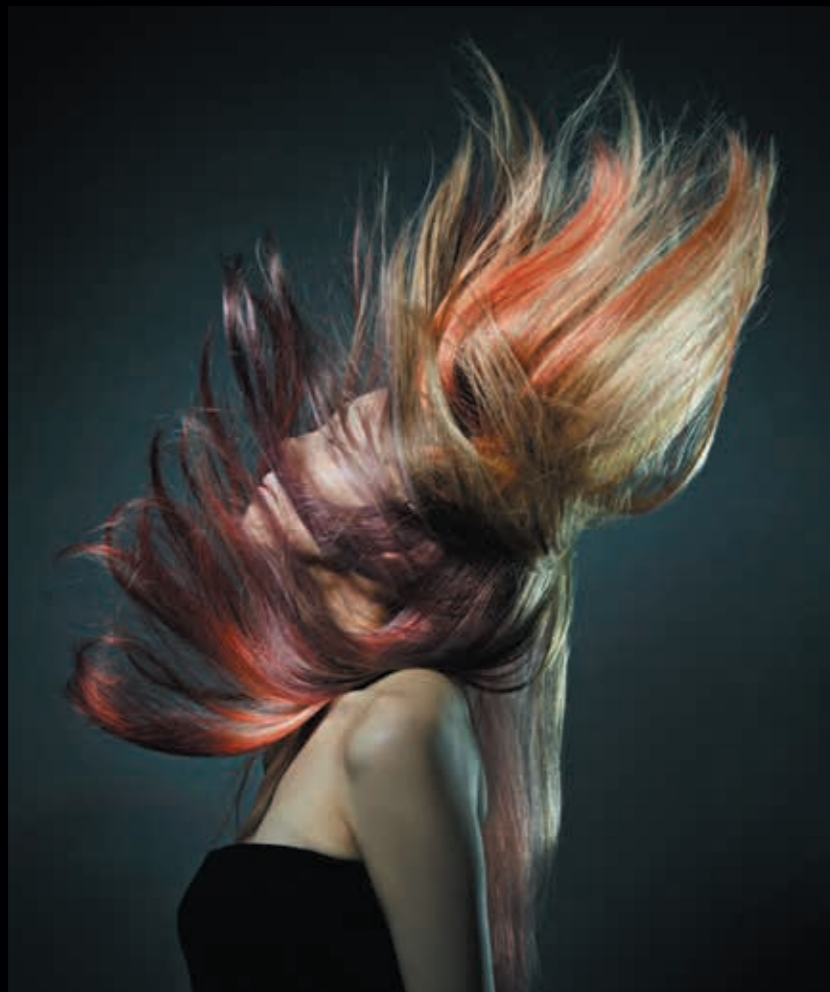
上:Phase One P45+ F4 閃光速度 1/7800秒 下:Canon 5DMark II F5.6 閃光速度 1/7800秒